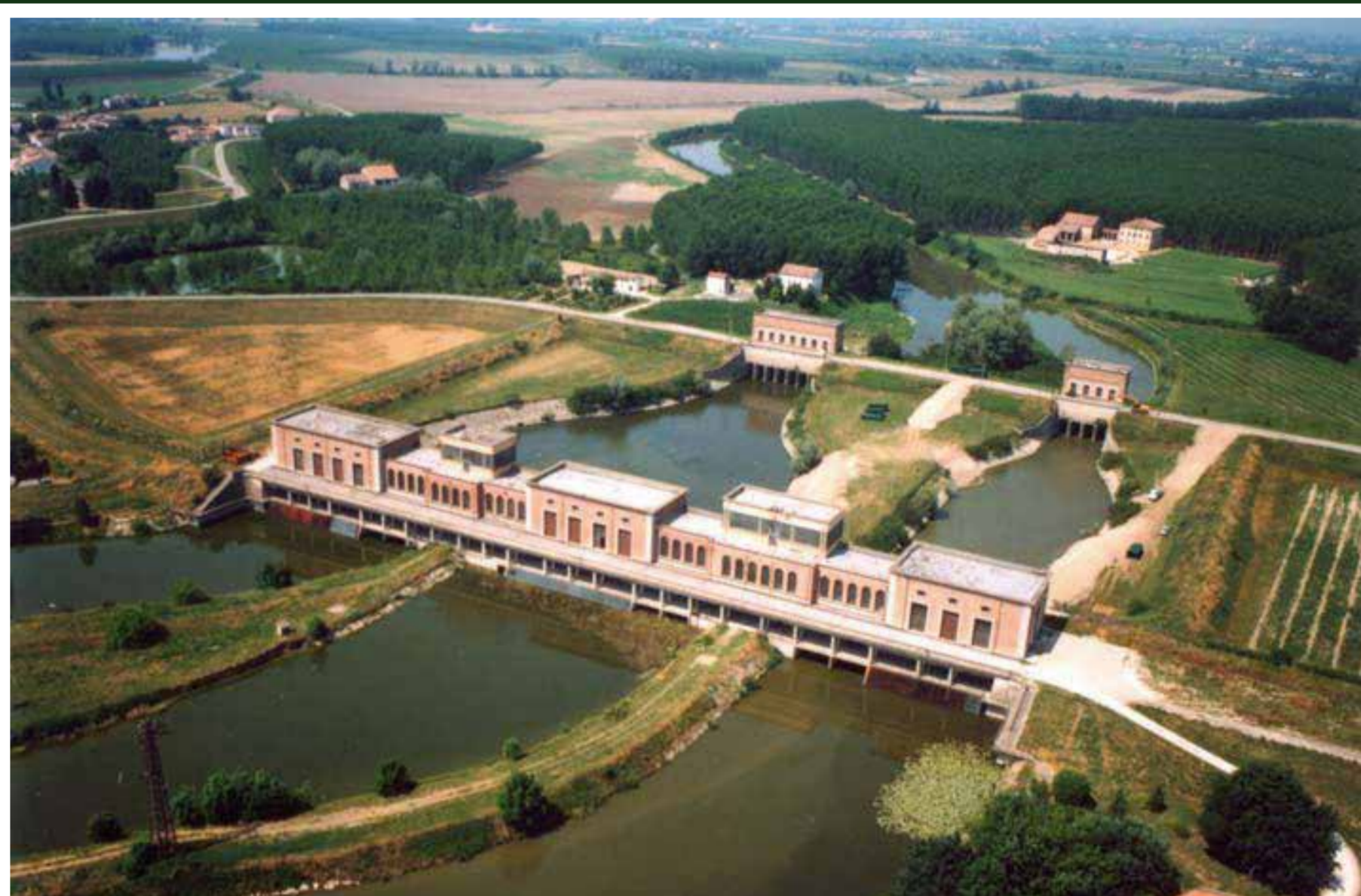
Impianto idrovoro di San Matteo delle Chiaviche

Per le intere giornate di Domenica 14 e Domenica 21 maggio l'impianto idrovoro di San Matteo delle Chiaviche sarà aperto a tutti per le visite, senza bisogno di prenotazione.